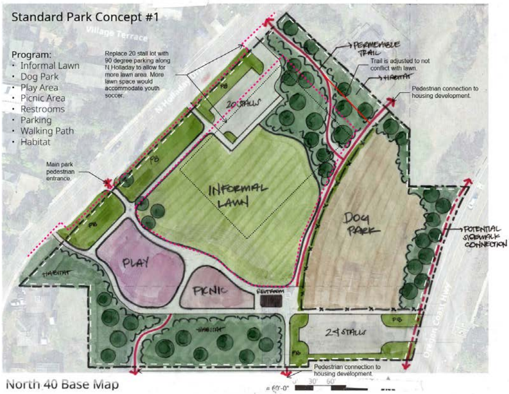
North 40 Base Map