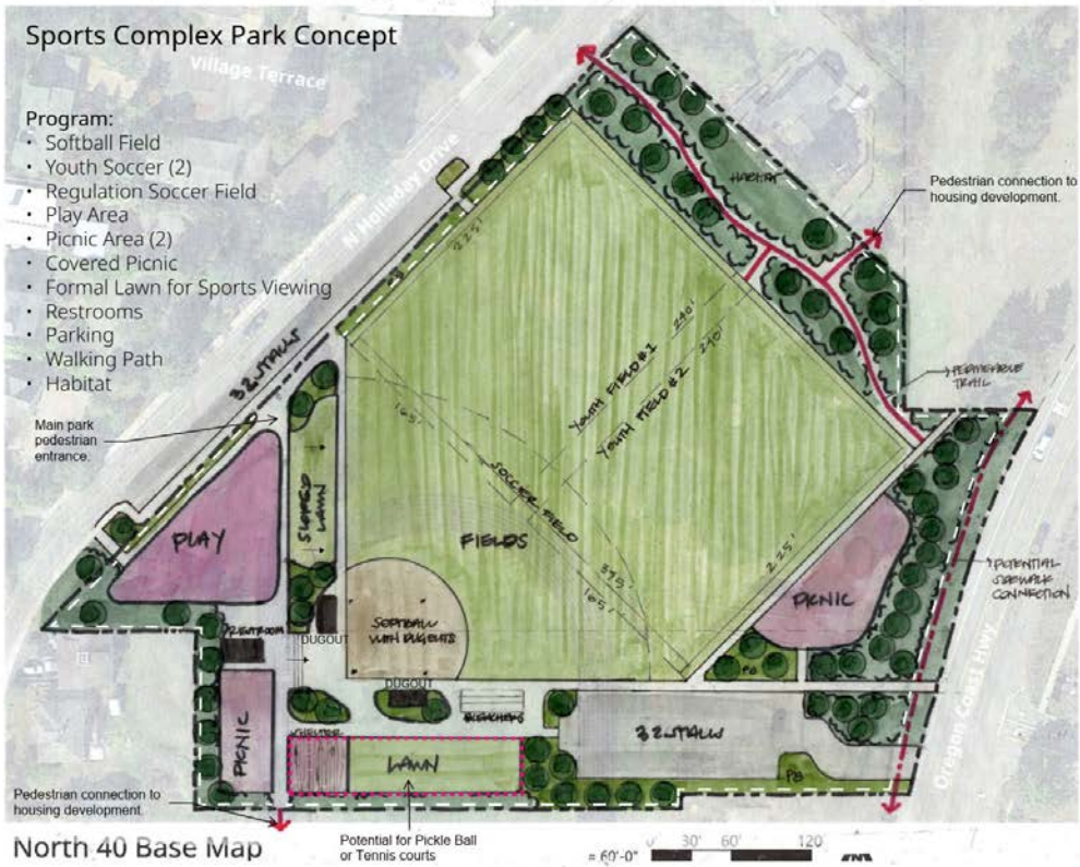
North 40 Base Map

Potential for Pickle Ball or Tennis courts